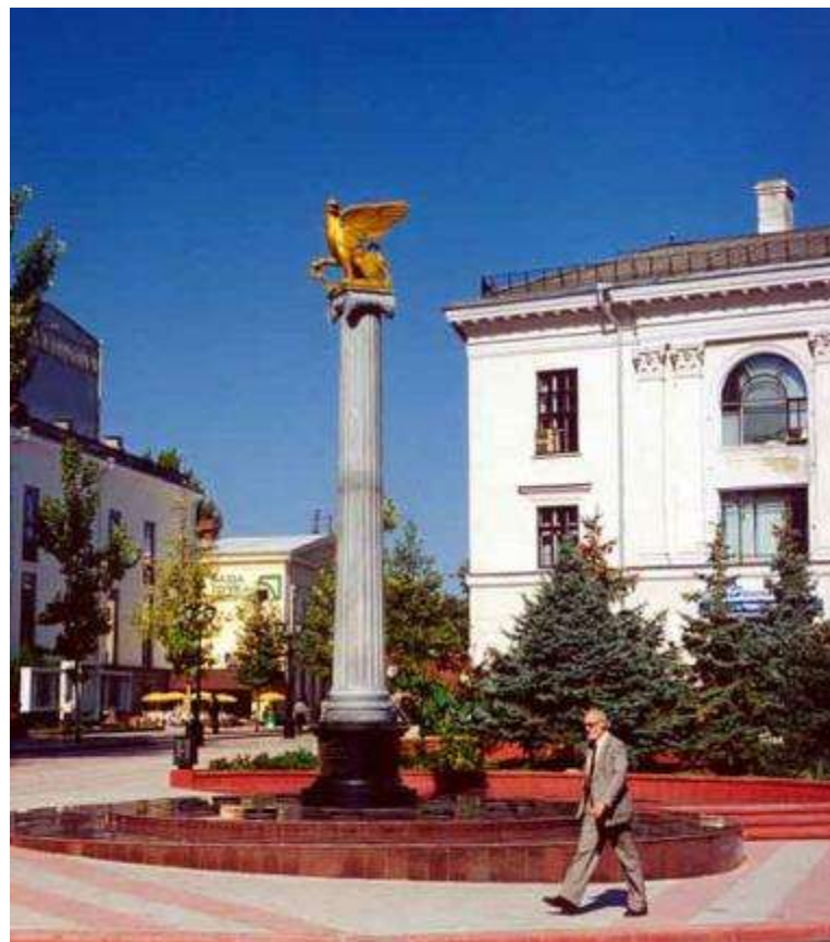
Памятный знак города-героя Керчи на центральной площади.