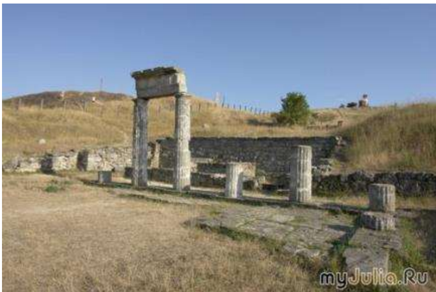
Городище Пантикапея (V век до н.э. — III век н.э.)

Керчь является одним из древнейших городов мира, расположенный в восточной части Крыма на берегу Керченского пролива.